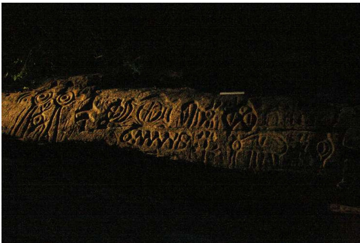
Pedra do Cruzeiro.

milhares de anos. Quanto vale a memória e a escrita sagrada de um povo que mora dentro da gente? “...faremos bem em recordar uma vez por outra que imagens e letras, são, realmente, parentes consangüíneas” (GOMBRICH, 1988, p. 30). Aproveito a deixa de Gombrich para chamar a atenção para a imagem abaixo, foto de Rui Faquini a mim enviada primeiramente por Elyeser Szturm, cedida por Rui e Liana Faquini, da Pedra do Cruzeiro. É uma foto noturna de parte da Pedra do Cruzeiro no córrego de mesmo nome, situado na margem esquerda do rio Tocantins, recém inundada para construção da UHE Peixe Angical: